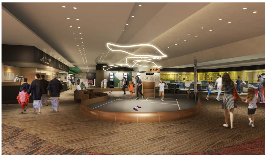
新エンターテイメント「SUGINOI BOWL & PARK」イメージ