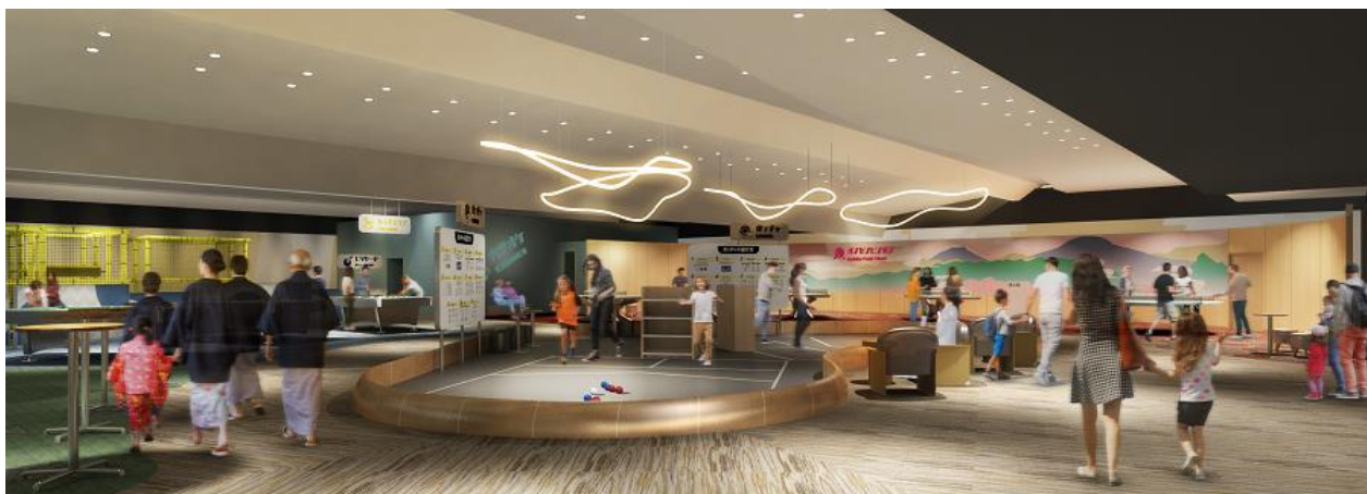
「SUGINOI BOWL & PARK」イメージ

世代を問わずみんなが楽しめるように、近年注目が高まるユニバーサルスポーツとして「ボッチャ」が新たに登場します。また、温泉地の定番「卓球」は、通常の卓球台に加えて円形の卓球台もあり、いつもとは一味違った対戦も可能です。さらに、デジタル映像の的に向けて弾を込めて撃つ「デジタル射的」は、デジタルとアナログの良さを生かしたコンテンツ。これまでも人気の高かった「ボウリング」をはじめ、「ビリヤード」「ダーツ」「カラオケ」、小さなお子さまが遊べる「キッズエリア」もそろい、みんなで“行ってみたい”“やってみたい”と思っただけのような充実のラインアップです。また、軽く体を動かした後や休憩の合間にぴったりの手軽に食べられるフードやアルコール・ソフトドリンクも販売します。