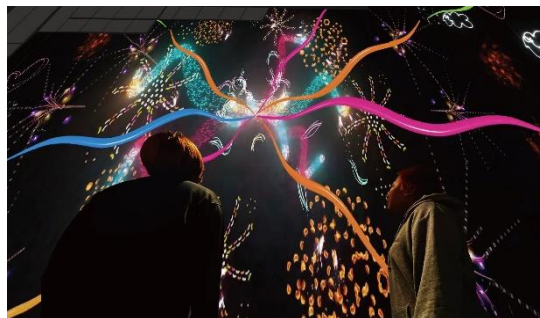
プロジェクションマッピングの世界観

屋内レジャープール「アクアビート」の建物の壁面を活用した「プロジェクションマッピング」の新プログラムを、2023 年 1 月 26 日（木）より公開します。武蔵野美術大学映像学科とコラボした「花火篇」、地上から飛び立つロケットと共に宇宙空間を旅する「宇宙篇」の 2 部構成になります。全長 58m の壁面に、次々に変化する大迫力の映像が投影され、ワクワク感の止まらない特別な体験をご提供します。